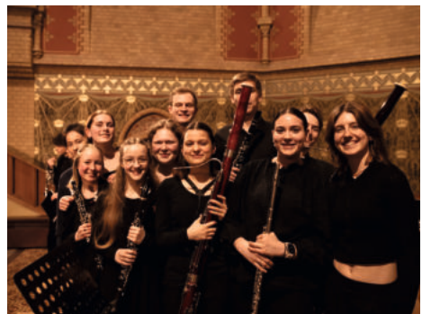
Junge Philharmoniker Brandenburg

Am Samstag, 9. Mai 21.00 Uhr wird wieder zum Gospelkonzert eingeladen - Karten gibt es im Ticketshop unserer Gemeinde (s. Homepage), bei der Tourist-Information und bei Reisebüro Jaich.